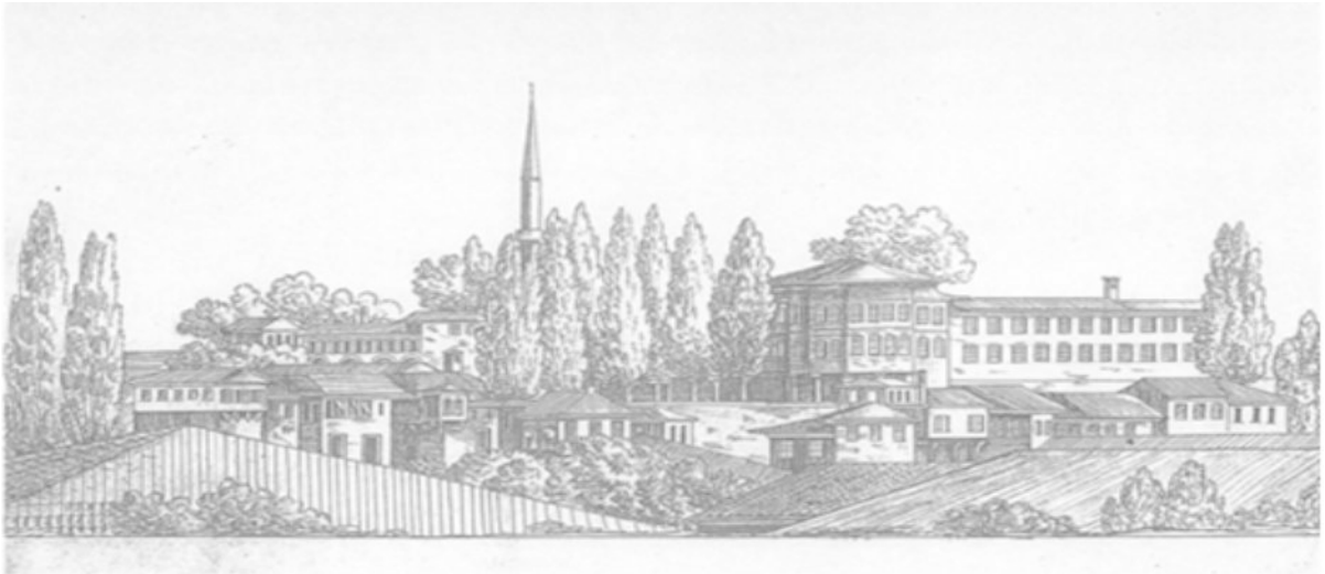
Resim 1. Mekteb-i Tıbbiye-i Adliye-i Şahane. (Fransız ressam Marius Fearud tarafından çizilmiş).