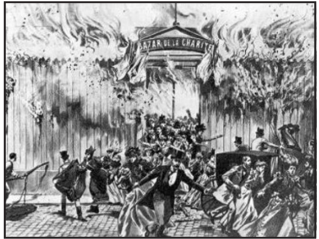
Resim 3. Yangın (7).