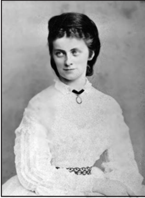
Resim 5. Düşes Sophie D'Alençon (8)