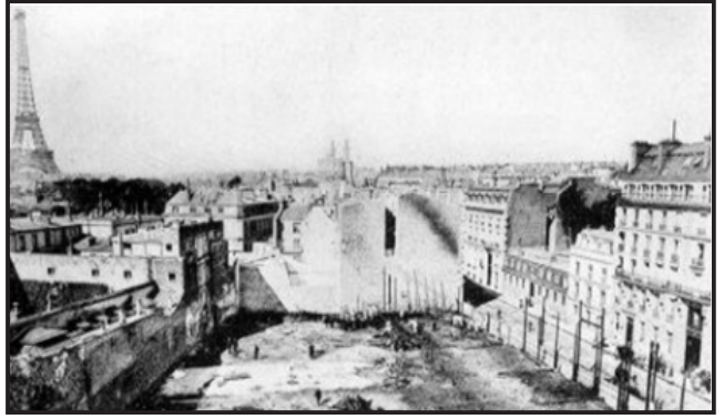
Resim 2. Bazaar de la Charite yangın sonrası görünüm (7).

Trajediden sonra Paris Emniyet Müdürü Lepine, rue Jean Goujon'daki kötü koşulların farkında olduğunu ancak organizasyonun kendine has doğası nedeniyle elinden pek bir şey gelmediğini, organizasyonun kendi otoritesinin ötesinde olduğunu iddia etmiştir (3). Yangında 126 kişi ölmüştür. Kurbanların sadece 6'sı erkektir. Yangının ardından basına, kurbanları kurtarmaya çalışan erkeklerin kahramanlık hikayeleri yansımıştır. Ancak, bu hikayeleri çürüten iddialar da vardır. Yangının soruşturmacısı M. Bertalus yaptığı araştırmada birçok erkeğin yangından kaçarken ilkel ve korkak davrandığını, bazı genç erkeklerin çıkışları kapattığını, bazılarının ise kaçarken bastonlarıyla kadınların yüzüne vurduğunu, bir kadının parmaklarının kırıldığını, bu kişilerin isimlerinin bilindiğini ve bir daha Paris sosyetesine kabul edilmelerinin mümkün olmadığını ifade etmiştir (3,9)