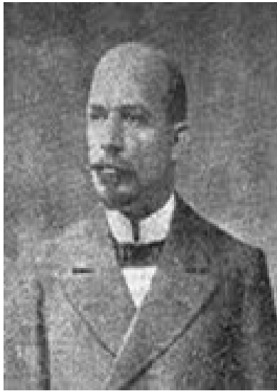
Resim 6. Dr. Oscar Amoedo (12)

Dr. Oscar Amoedo, aynı yıl Moskova'da yapılan uluslararası bir tıp kongresinde “Bazar de la Charite felaketi kurbanlarının kimliklendirilmesinde dış hekimlerinin rolü” başlıklı çalışmasını sunar. “L'Art dentaire en Medecine Legale” adlı adli diş hekimliğinin temellerini oluşturan kitabı yazan Dr. Amoedo bu çalışmalarından sonra “Adli Diş Hekimliğinin babası” olarak anılacaktır (6,10,11).