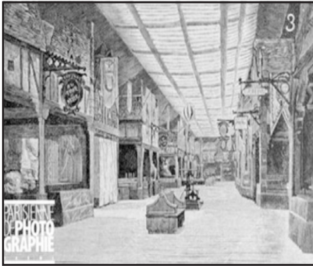
Resim 1. Bazar de la Charite (1897) (5)

planlanan etkinlik genellikle Mayıs ayında gerçekleştirilirken, rahibeler ve papalık elçileri etkinliği kutlamak için her yıl organizasyonun ilk günü pazar mekanına gelmişlerdir. 4 Mayıs 1897'de çıkan yangın sonrasında organizasyon bir daha gerçekleştirilmemiştir (3,4). Bazar de la Charite varlığını sürdürdüğü yıllar içinde, değişik mekanlarda kurulmuştur. Fiziksel şartlar, mekanın kirası ve müşteri potansiyeli organizasyon komitesinin mekan seçimindeki temel kriterleridir. 1897 yılında yapılacak organizasyon için pazar mekanı olarak 19 rue Jean Goujon'da seksen metre uzunluğunda, on üç metre genişliğinde boş ahşap bir hangar kiralanmış, binanın içine karton, mukavva, bez ve ahşaptan eski Paris'i taklit eden bir ortaçağ caddesi tasarlanmıştır.