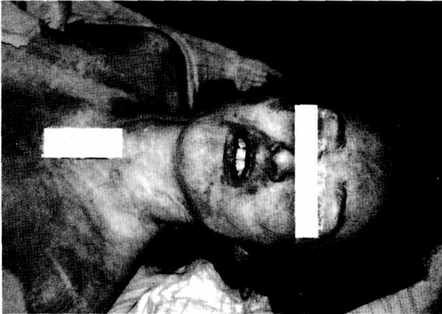
Resim 1: Sol dudak kenarındaki ekimotik alan

İç muayenede; baş açıldığında saçlı deri altının yer yer noktavi kanamalı olduğu, beyin ve beyinciğin 1300 g tartıldığı, sağ temporal lob üzerinde sıvama tarzında 5x4 cm.'lik, sol frontal lob altında 1x0,5 cm.'lik subdural kanama görüldüğü(Resim 2), beyin kesitlerinin hiperemik olduğu, göğüs açıldığında sol klavikulanın ortadan ekimozlu kırık bulunduğu,ka-burgaların solda 4,5,6,7,8, sağda 2,3,4,5,6 hizasında, sternumun 2-3 interkostal aralıkta ekimozlu kırık bulunduğu, sol göğüs boşluğundan 500 cc, sağ göğüs boşluğundan 100 cc. kan boşaltıldığı, her iki akciğe-