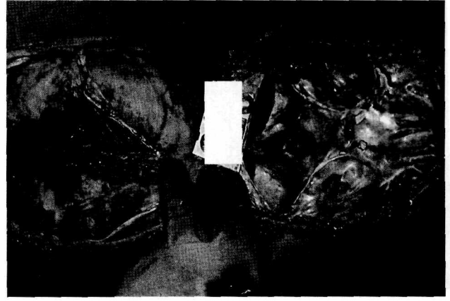
Resim 2: Sol frontal lob altında subdural kanama

rin 500 g tartıldığı,yüzeylerinde yaygın subplevral, kesitlerinde yaygın doku içi kanamaları tesbit edildiği, kalbin 250g tartıldığı, batın açıldığında karaciğerin 1500 g tartıldığı, kesitlerinin hiperemik bulunduğu, servikal bölge incelendiğinde ekstradural yerleşimli yaygın koagüle kanama görüldüğü,