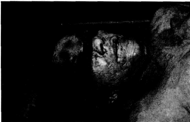
Resim 4: Yüzdeki travmatik değişimler

Saldırganlar üzerinde yapılan araştırmalarda güven