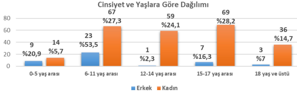
Şekil 1. Mağdurların cinsiyet ve yaşa göre dağılımı (n)