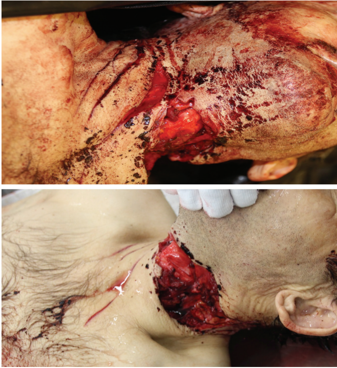
Resim 2. Boyun solda öldürücü nitelikte kesik vasıfta yara ve boyun sağda tereddüt kesileri (Olgu 1)

Sunulan olguda soruşturma dosyası ve kolluk kuvvetinden edindiğimiz bilgiler; katil ve maktulün karı koca oldukları ve çocukların olaya tanıklık ettikleri, çocukların ifadelerinde anne babalarının sorunlu bir evliliklerinin olduğu ve boşanma aşamasında oldukları, annenin kendileri ile birlikte çocuk odasında bulunduğu sırada babalarının odaya gelerek