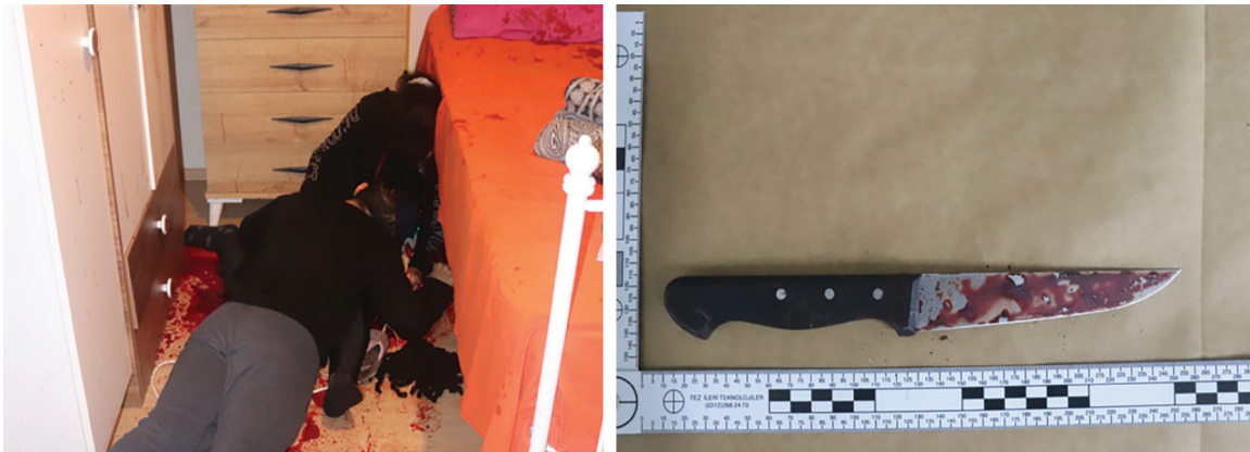
Resim 1. Her iki cesedin olay yerindeki konumu (solda) ve olayda kullanılan delici kesici alet (sağda)

Ölümler meydana geliş şekli bakımından doğal ve zorlamalı ölümler olarak ikiye ayrılır. Zorlamalı ölümler dış faktörlerin (fiziksel, kimyasal, radyasyon vb.) neden olduğu ve cinayet, kaza, intihar sonucu meydana gelebilen ölümlerdir (1). Her ne kadar, orijin tayini adli tıbbın görevi olmasa da bütün zorlamalı ölümler adli tıbbın konusudur ve elde edilen bulgular adli makamların kararına katkı sağlar. Bu katkı