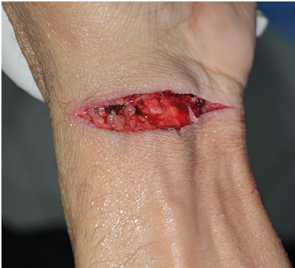
Resim 5. Sol el bileğinde büyük damar yaralanmasına neden olmamış kesici delici alet yarası.

Kesici-delici aletlerle meydana gelen intihar olgularında bazı morfolojik kriterler tanımlanmıştır. Bunlar; kalp bölgesi ağırlıklı olmak üzere kolay erişilebilir vücut bölgelerinin hedeflenmesi, kesici-delici aletin uygulandığı yerde giysilerin çıkarılmış olması, sağ elini kullananlar için yaraların vücudun sol tarafında görülmesi, yaraların düzensiz ve grup halinde küçük bir alanda sınırlanması, kosta ve sternumda seyrek olarak delinme, savunma yaralarının bulunmaması, 10'dan az sayıda derin kesici-delici alet yarası şeklinde belirtilmiştir. Bizim olgumuzda toraks duvarının sol yanında cilt, cilt altı doku seyirli çok sayıda kesici alet yaraları mevcuttur. Bu durum öncelikle kalp bölgesinin hedeflenmiş olabileceğini, bireyin kazağının da hedef bölgelere ulaşımı kolaylaştırmak amacıyla yukarıya doğru kaldırıldığını