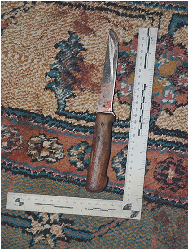
Resim 1. İntihar amacıyla kullanılan bıçak

İntihar ‘bireyin duygusal, ruhsal ya da sosyal nedenlerin etkisiyle kendi yaşamına son vermesi’ olarak tanımlanmaktadır (1). İntihar yöntemi seçiminde kültürel yapı, etnik grup, yaş, cinsiyet, ulaşılabilirlik gibi birçok faktör etkilidir. Bugüne kadar yapılan çalışmalarda, kullanılan intihar yöntem yüzdelikleri birbirinden farklı olsa da medikal literatürde en sık kullanılan intihar yöntemi ası olup, bunu ateşli silah, yüksekten atlama ve kimyevi madde alımı takip etmektedir (2). İntihar yöntemlerinin dağılımına bakıldığında; bir çalışmada, 232 (%52,3) olgu ile ası ilk sırada yer alırken, bunu 126 olgu (%28,4) ile ateşli silah kullanımı, 40 olgu (%9) ile kimyevi madde kullanımı (ilaç ve tarım ilacı), 33 olgu (%7,4) ile yüksekten atlama takip etmektedir (3). 2002-2009 yılları arasında intihar eden olguları kapsayan bir çalışmada, olguların %47’sinin ası, %23,5’inin ateşli silah, %14,2’sinin kimyevi madde, %9’unun yüksekten atlama yöntemini kullandığı gözlenmiştir (4). Kesici-delici alet ile intihar tüm intiharların %2’sini oluştururken, neredeyse Harakiriye eş değer olan batına yönelik kesici-delici aletlerle meydana gelen intihar oranı %0,2’dir. Bu düşük insidans eğilimi, 1983’ten 2016’ya gözden geçirilen literatürde değişmeden kalmıştır (5).