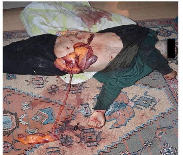
Resim 2. Olay yerine gidildiğinde cesedin pozisyonu.

Bu çalışmanın hazırlanması sırasında Helsinki Bildirgesi’ne kriterleri göz önünde bulundurulmuştur.