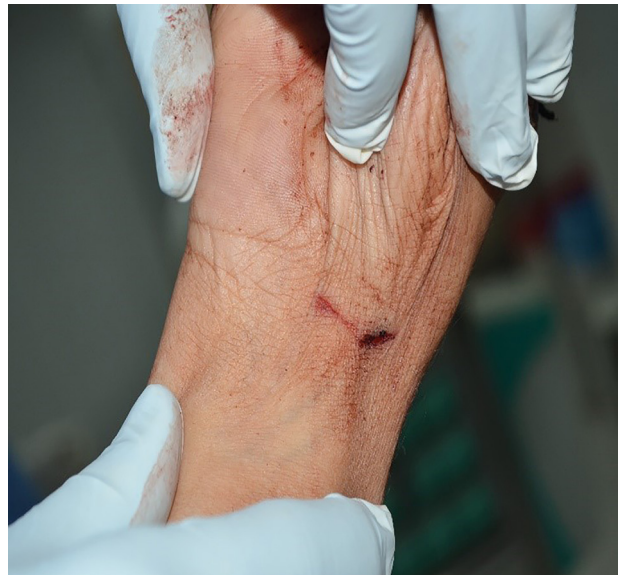
Resim 4. Sağ el bileğinde kesici-delici alet ile meydana getirilen tereddüt kesileri.